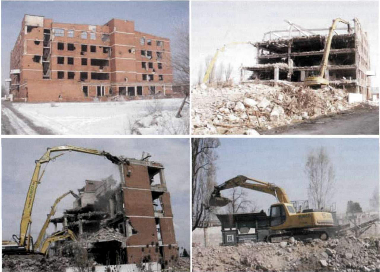
Faze rušenja građevine Borovo-Commerce u Vukovaru

izvedena, sa armaturom presjeka do 40 mm i betonom marke MB 50 i više. Rušenje je obavljeno u roku 45 dana uz primjenu bagera gusjeničara opremljenih s dugačkim rukama dohvata 24 m i specijalnim hidrauličkim alatima za drobljenje betona i sječenje armature. Za izvršenje rušenja angažirano je ukupno 6 bagera gusjeničara različitih veličina (od najmanjeg težine 15 do najvećeg 65 tona). Za rušenje najviših dijelova zgrade korištena su dva bagera s dugačkim rukama 24 m i jedan s višenamjenskom rukom od 20 m. S obzirom na visinu zgrade od 32 m, za dohvata najviših dijelova izrađena je privremena pristupna rampa u visini od 7 m. Posao izmještanja materijala i pripreme pristupne rampe obavio je veliki bager 65 tona sa žlicom volumena 2,6 m 3 . Reciklaža materijala je obavljena u dvije faze: