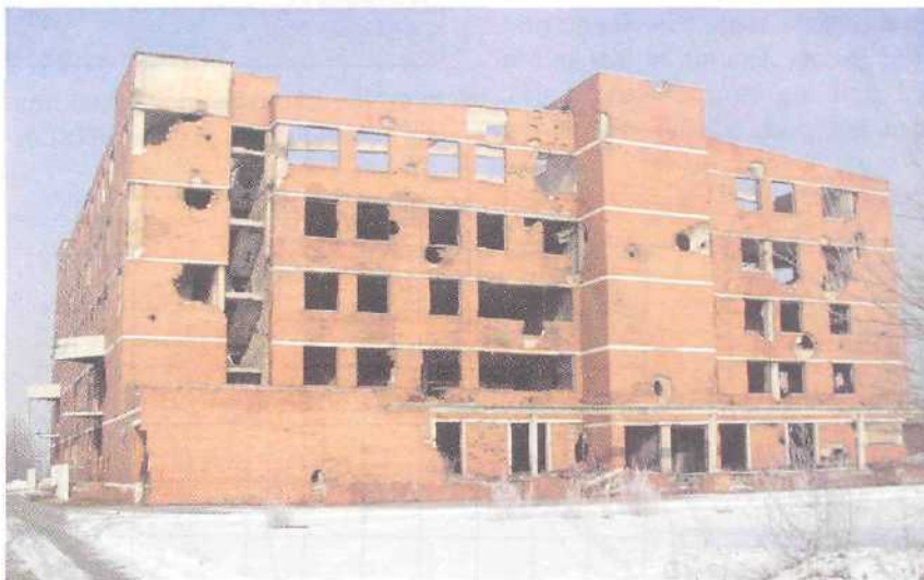
Zgrada Borovo-Commerca prije rušenja

kovskim pogodcima. Ministarstvo za javne radove, obnovu i graditeljstvo donijelo je odluku o uklanjanju građevine radi oslobađanja prostora za izgradnju buduće gospodarske zone. Zgrada je bruto površine od 20.000 m 2 , konstrukcija je bila vrlo kvalitetna, jako armirana i betonom marke 50 i više. Rušenje je obavljeno u 60 dana uz primjenu bagera gusjeničare opremljenih rukama dohvata 24 m i specijalnim hidrauličkim alatima za drobljenje betona i sječenje armature. Bilo je angažirano 6 bagera različitih veličina - od 15 do 65 tona.