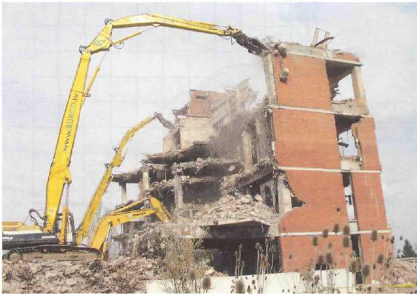
Rad više bagera na rušenju iste zgrade