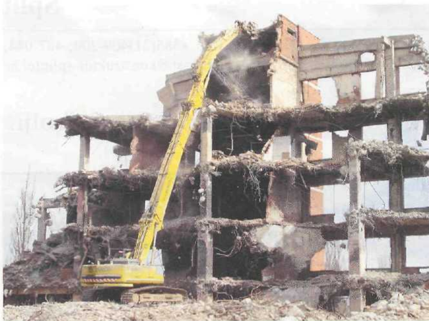
Jednu od faza rušenja

S obzirom na visinu od 32 m, za dohvat najviših dijelova na visini od 7 m izrađena je privremena pristupna rampa. Posao premještanja materijala i pripreme pristupne rampe obavio je veliki bager od 65 tona. Reciklaža je obavljena u dvije faze: Najprije je