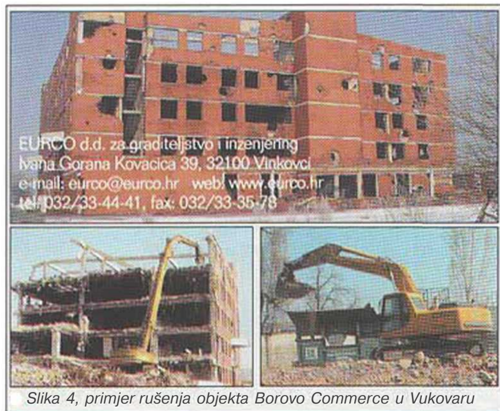
Slika 4, primjer rušenja objekta Borovo Commerce u Vukovaru

Prikazani primjer rušenja u ratu oštećene zgrade Borovo-Commercea u Vukovaru radi stvaranja slobodnog prostora za izgradnju buduće Gospodarske zone Vukovar, demonstrira praktični aspekt filozofije uklanjanja građevinskih objekata.