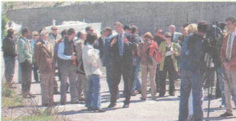
Rušenje dimnjaka okupilo je političke dužnosnike i novinare