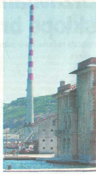
Zbogom zlokobnom dimnjaku nad Bakrom