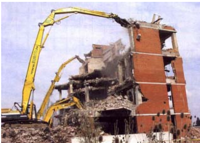
Rad više bagera na rušenju iste zgrade