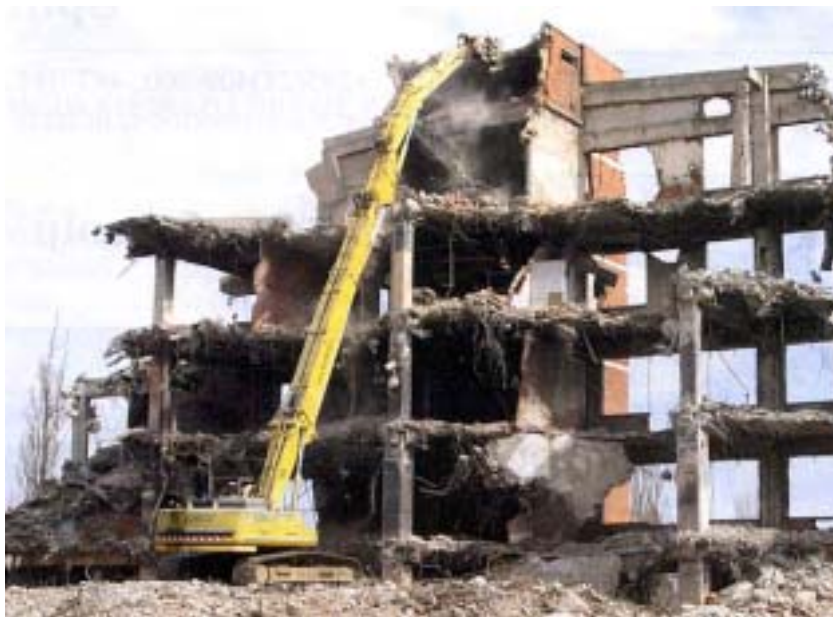
Jedna od faza rušenja

S obzirom na visinu od 32 m, za dohvat najviših dijelova na visini od 7 m izrađena je privremena pristupna rampa. Posao premještanja materijala i pripreme pristupne rampe obavio je veliki bager od 65 tona. Reciklaža je obavljena u dvije faze: Najprije je