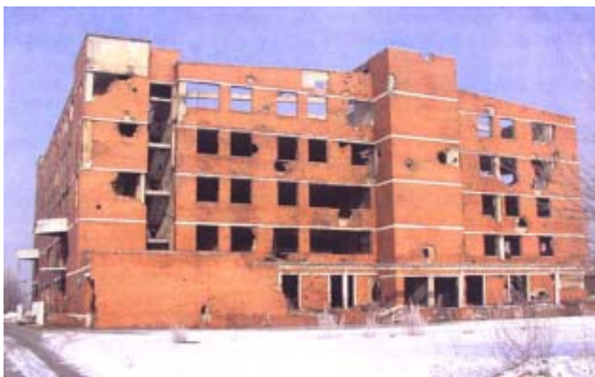
Zgrada Borovo-Comerca prije rušenja

kovskim pogocima. Ministarstvo za javne radove, obnovu i graditeljstvo donijelo je odluku o uklanjanju građevine radi oslobađanja prostora za izgradnju buduće gospodarske zone. Zgrada je bruto površine od 20.000 m 2 , konstrukcija je bila vrlo kvalitetna, jako armirana i betonom marke 50 i više. Rušenje je obavljeno u 60 dana uz primjenu bagera gusjeničara opremljenih rukama dohvata 24 m i specijalnim hidrauličkim alatima za drobljenje betona i sječenje armature. Bilo je angažirano 6 bagera različitih veličina – od 15 do 65 tona.