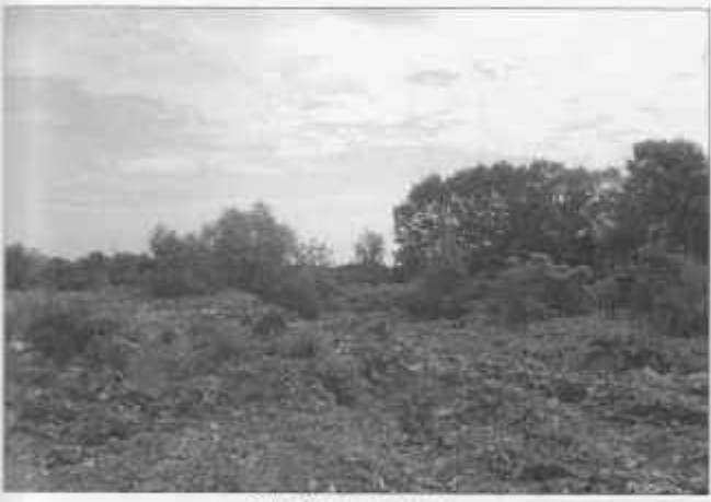
Slika 3: Početno stanje