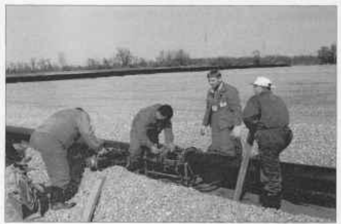
Slika 6: Izvođenje radova