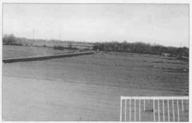
Slika 8: Pogled na veliku kazetu