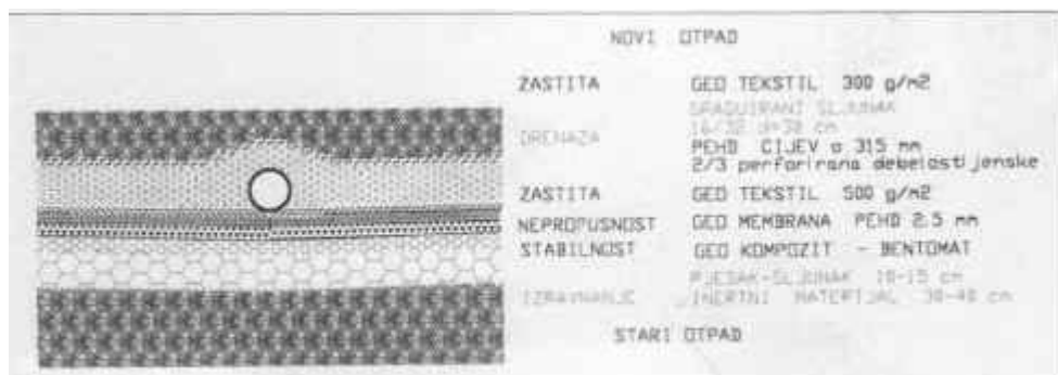
Slika 1: Presjek slojeva temeljnog brtvenog sustava

Učešće investitora (Grad Sisak - 40% iz sredstava