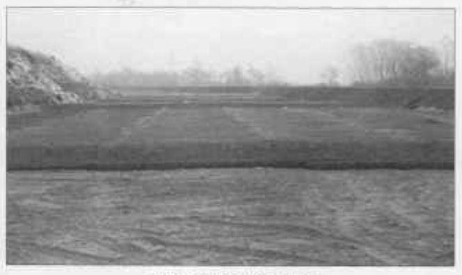
Slika 7: Sanacija male kazete