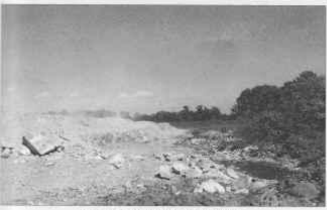
Slika 4: Početak radova - mala kazeta