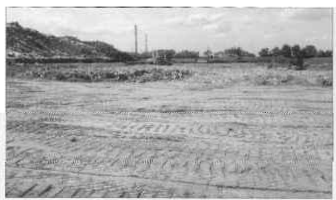
Slika 5: Početak radova - velika kazeta